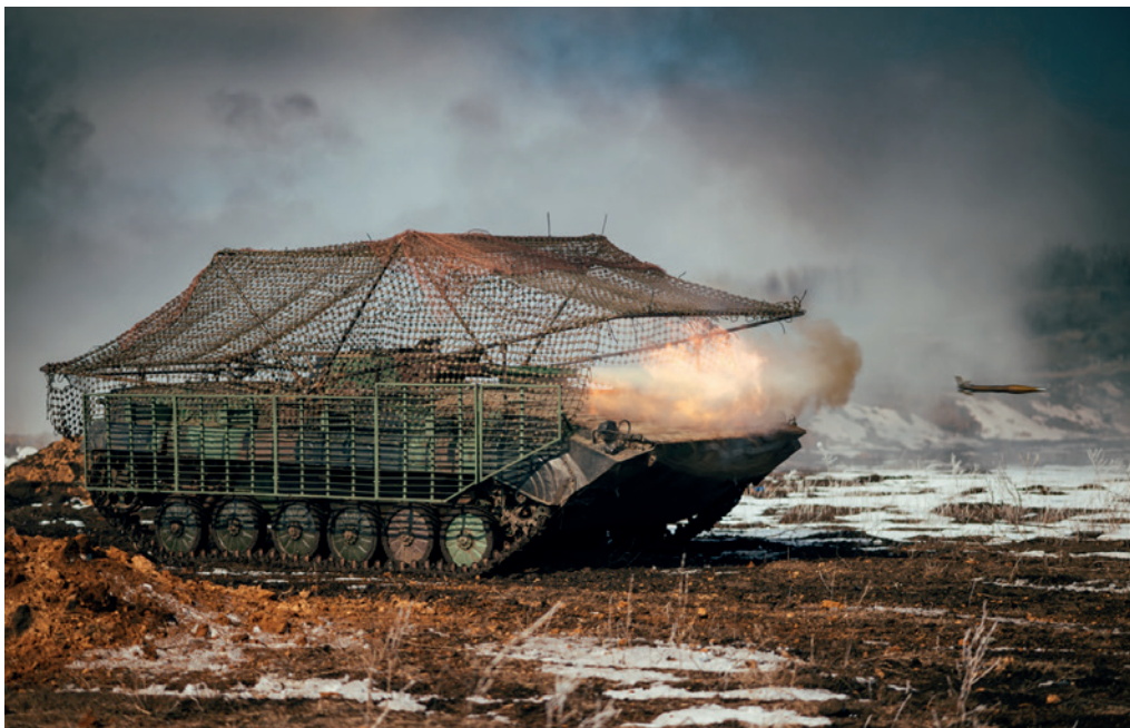
Photograph No. 5, titled "Training live-fire exercises of a BMP-1 of the 2nd Mechanised Battalion of the 23rd Separate Mechanised Brigade at the Dimurino training range. February 2025", from the Master's degree photo art project.