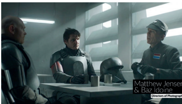
Фото 3. Кадр з 2 сезону «Мандалорця». Освітлення на акторах і декораціях генерується безпосередньо LED-екранами «The Volume», створюючи нерозривний синтез фізичного та цифрового. Це формує «гіперреальність до-постпродакшну», де CGI стає вагомою частиною знімального процесу. Джерело: (Desowitz, 2021).

Персонаж створений переважно як практична лялька (компанією Legacy Effects), що дає змогу акторам взаємодіяти з ним фізично, забезпечуючи «матеріальність» та «естетику потертості», притаманну оригінальній трилогії. Джерело: (Busch, 2023).