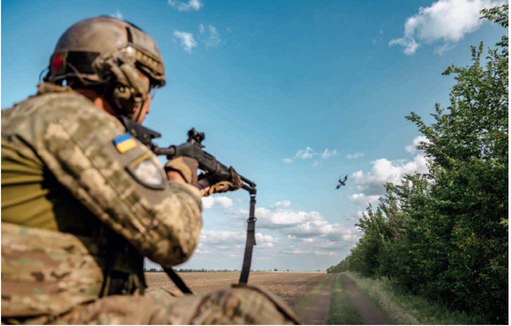
Photograph No. 10 titled "Training to Engage FPV Drones by Medics of the 3rd Mechanised Battalion of the 23rd Separate Mechanised Brigade. Outskirts of the settlement of Pokrovske. June 2025" from the Master's degree photo art project.