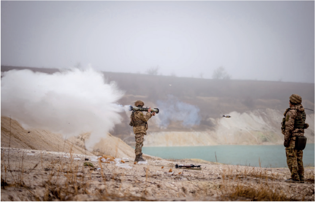
Photograph No. 12, titled "Training with the MATADOR Disposable Anti-Tank Launcher Conducted by an Instructor with the Call Sign 'Mina' at a Training Range near the settlement of Prosyana. January 2025", from the Master's degree photo art project.