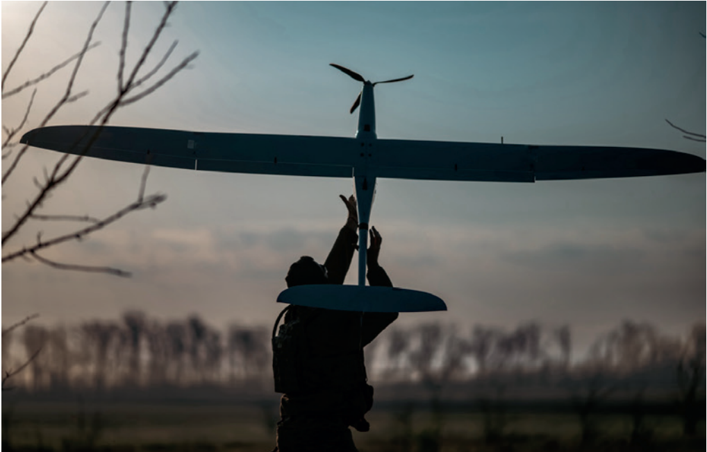
Photograph No. 11, titled "Launching a FlyEye reconnaissance drone at combat positions by an operator of the Unmanned Systems Battalion of the 23rd Separate Mechanised Brigade. Outskirts of the settlement of Voskresenka. April 2025", from the Master's degree photo art project.