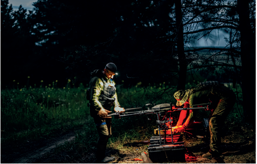
Photograph No. 3, titled "Securing a TM-62 mine on a 'Vampir' drone before a combat sortie on the Kharkiv axis. Unmanned Systems Battalion of the 23rd Separate Mechanised Brigade. July 2024", from the Master's degree photo art project.