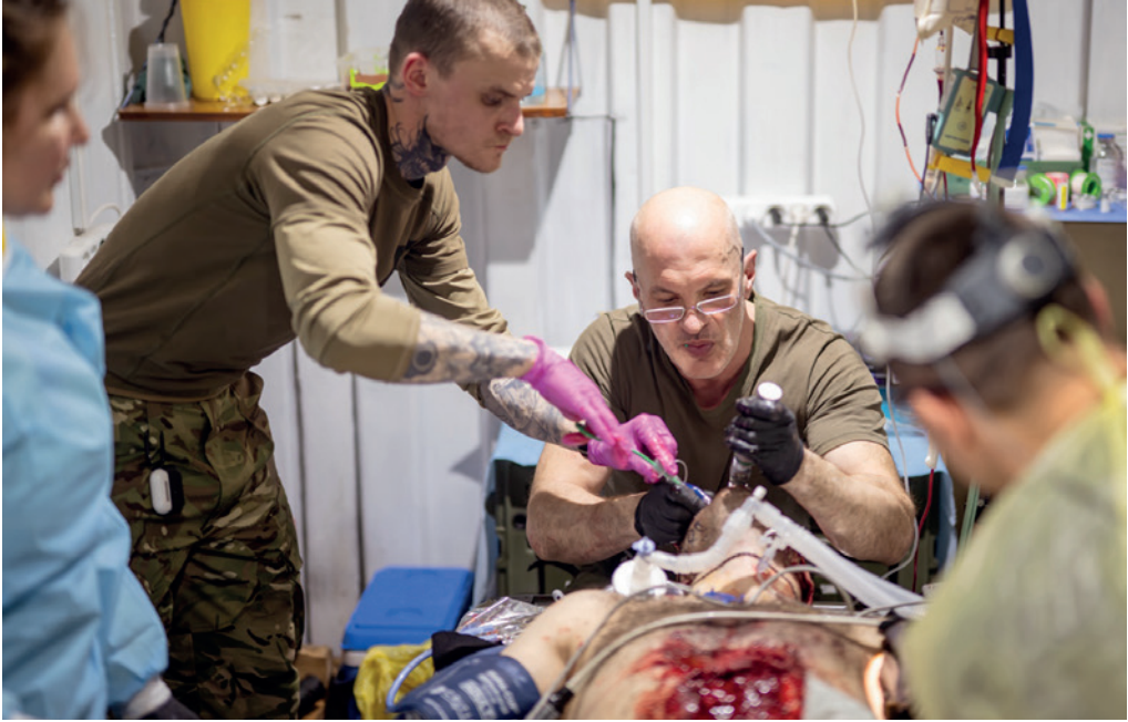
Photograph No. 7, titled "Intubation of a severely wounded soldier at the stabilisation point of the 23rd Separate Mechanised Brigade. Outskirts of the village of Piddubne. March 2025", from the Master's photo art project.