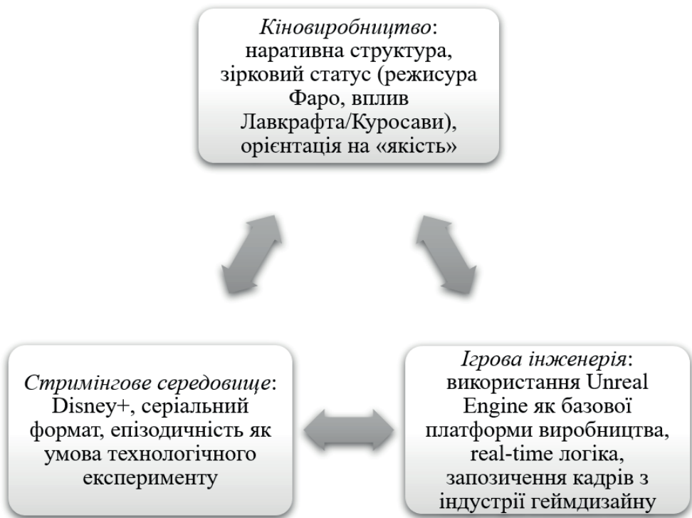
Рис. 1. Три екосистеми, що конвергуються в космічному вестерні «The Mandalorian» (складено на основі: Thomas, 2025).

часі, трансформує виробничі практики, стираючи межу між знімальним майданчиком і постпродакшном, та породжує нову естетику, засновану на синтезі фізичного й цифрового. Цей симбіоз уможливорює розгляд «Мандалорця» як маніфесту екосистемної конвергенції, де технологічні інновації, економічна логіка стримінгу та нарративні стратегії разом утворюють нерозривну цілісність (рис. 1).