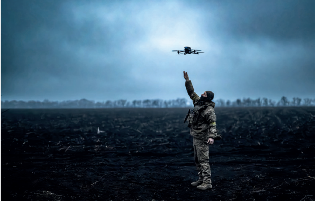
Photograph No. 6, titled "UAV operator of the 'Zhnyets' Unmanned Systems Battalion, callsign 'Khmil,' launching a Mavic reconnaissance drone at combat positions. Novopavlivka direction. March 2025", from the Master's degree photo art project.