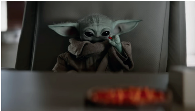
Фото 2. Грогу (Baby Yoda) як втілення синтезу analog і digital.

контексті «Мандалорець» пропонує не просто технологічне вдосконалення, а нову естетичну парадигму, де межа між знятим і згенерованим остаточно стирається, поступаючись місцем цілісному аудіовізуальному досвіду, в якому глядач споживає не гібрид окремих елементів, а нерозривну єдність фізичного та цифрового світів (Unreal Engine for Filmmaking, 2025).