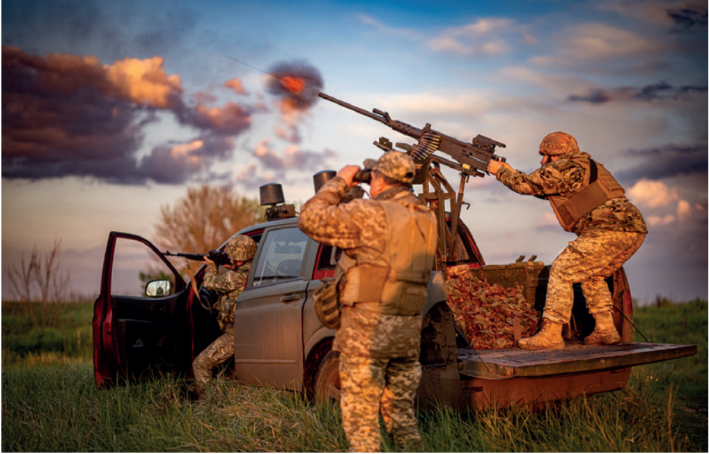
Photograph No. 4, titled "Combat operation of a mobile fire group of the Anti-Aircraft Missile and Artillery Battalion of the 23rd Separate Mechanised Brigade in the area of the settlement of Iskra. May 2025", from the Master's photo art project.