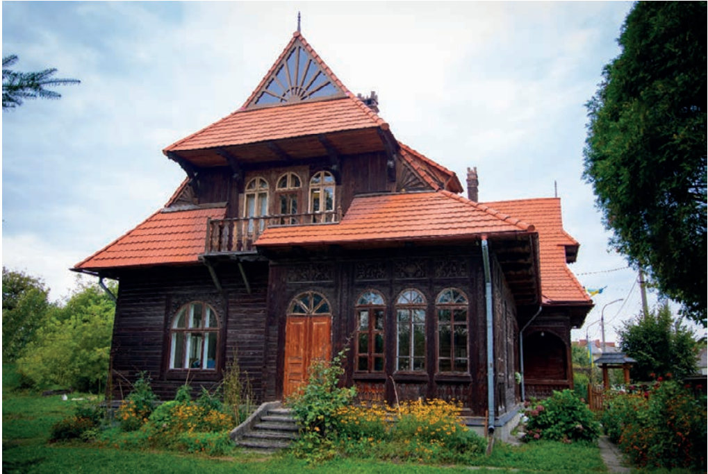
«Вілла Шафранів» з серії магістерського фотомистецького проєкту «Древній Самбір у сучасних світлинах»