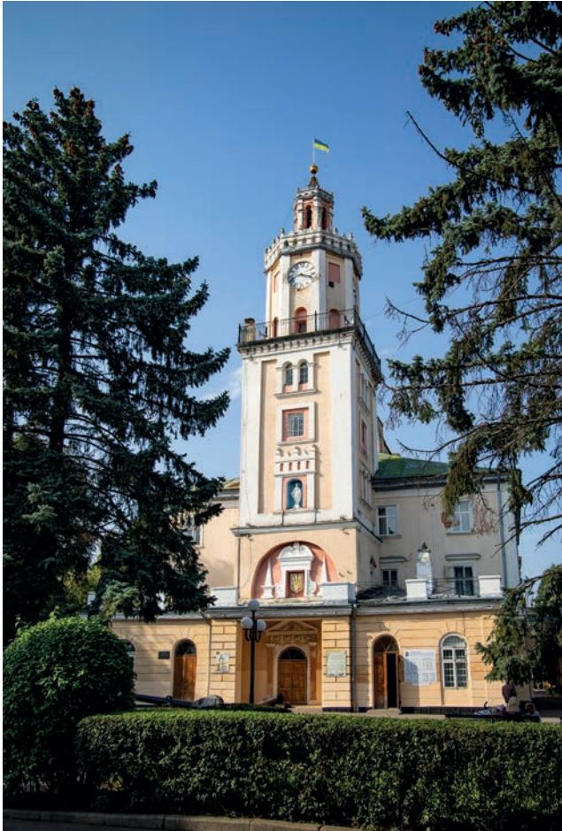
«Міська вежа» з магістерського фотомистецького проєкту «Древній Самбір у сучасних світлинах»