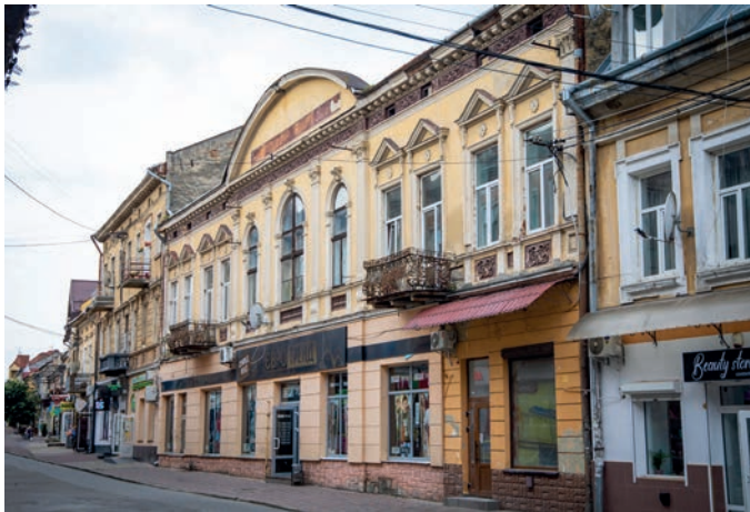
«З різницею в століття» з серії магістерського фотомистецького проєкту «Древній Самбір у сучасних світлинах»