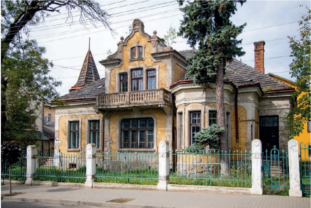
«Вілла Козакевичів» з серії магістерського фотомистецького проєкту «Древній Самбір у сучасних світлинах»