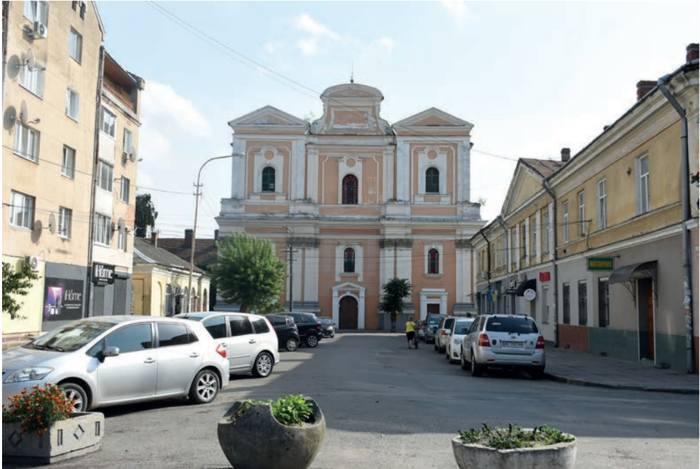
«Будівля з великою історією» з серії магістерського фотомистецького проєкту «Древній Самбір у сучасних світлинах»