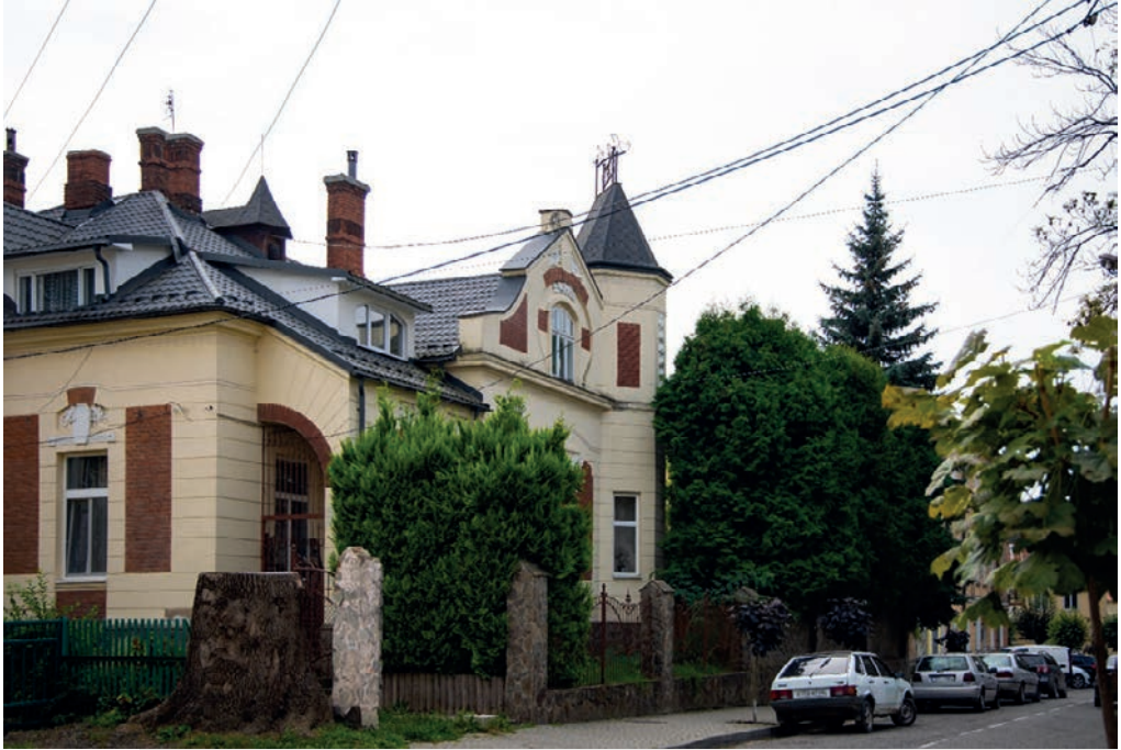
«Будинок Стебельських» з серії магістерського фотомистецького проєкту «Древній Самбір у сучасних світлинах»