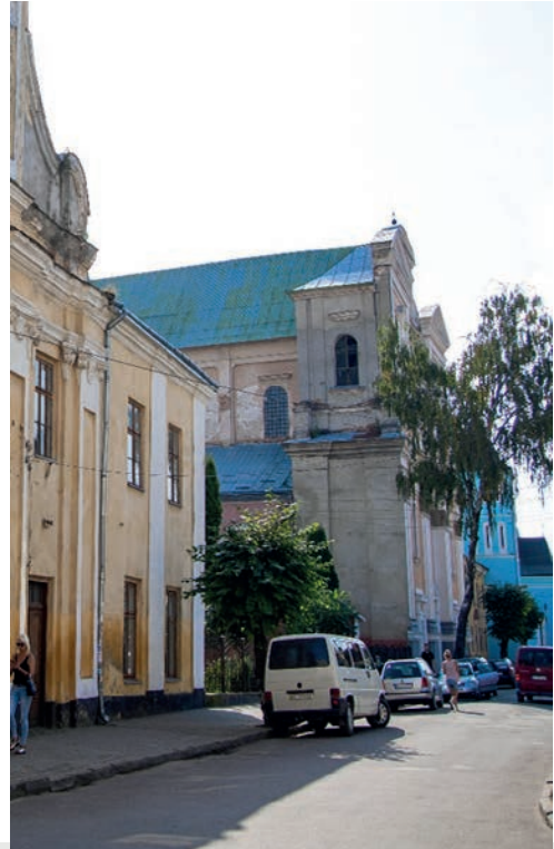
«Автентичний ансамбль» з серії магістерського фотомистецького проєкту «Древній Самбір у сучасних світлинах»